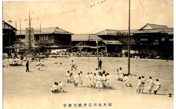
會勤區校學範師縣井福